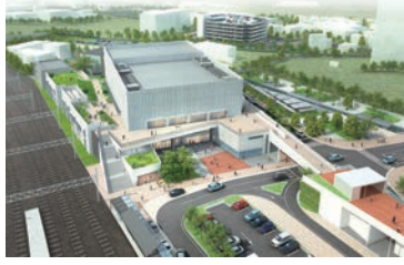
施設東側から見た完成イメージ

また、市民の健康意識の醸成や健康寿命の延伸等を目的として、地域医療と連携したメデイカルフィットネス施設「ライファイブ」や「アカデミーラボ」が併設される。