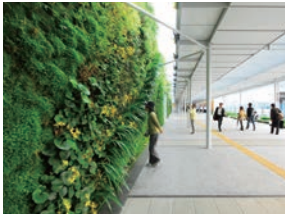
15年10月完成の南北自由通路

「ターミナルパーク整備」事業だ。総事業費約160億円の巨大プロジェクトで、「新山口駅」