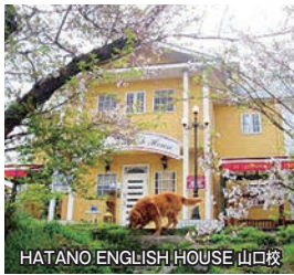
HATANO ENGLISH HOUSE 山口校

山口市宮野下1361-1 TEL083-923-7001 FAX083-923-7500 http://hatano-eng.com/ 【会社概要】幼児・小学生・中学生・高校生対象の英語教育。建学の精神は「Manners&English」。創立35周年を9月1日に迎える。