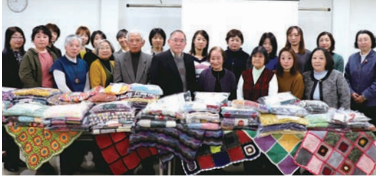
贈呈式に参加した、ゆだ苑と被爆者の方々、組合員の皆さま

昨年12月10日、組合員の代表が山口県原爆被爆者支援センターゆだ苑を訪れ、各地域の組合員さんが心をこめて編んだひざかけや肩かけ小物等102点を贈りました。この取り組みは、被爆者の方々に暖かい冬を過ごしていただきたいという組合員さんの想いで、1986年から続いています。組合員さん一人一人がモチーフを編まったり、毛糸を寄付してくださったり、集まったモチーフをつなぎあわせたりして、一枚のひざかけが作られています。あわせて、組合員さんから寄せられた虹の平和・おまかせ募金から20万円をゆだ苑活動支援として寄付しました。