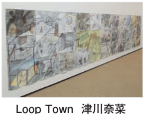
Loop Town 津川奈菜

今回の大賞は、33枚の紙に描かれたドロイングの作品である。絵に中心がないので、どこから見てもいいのだ