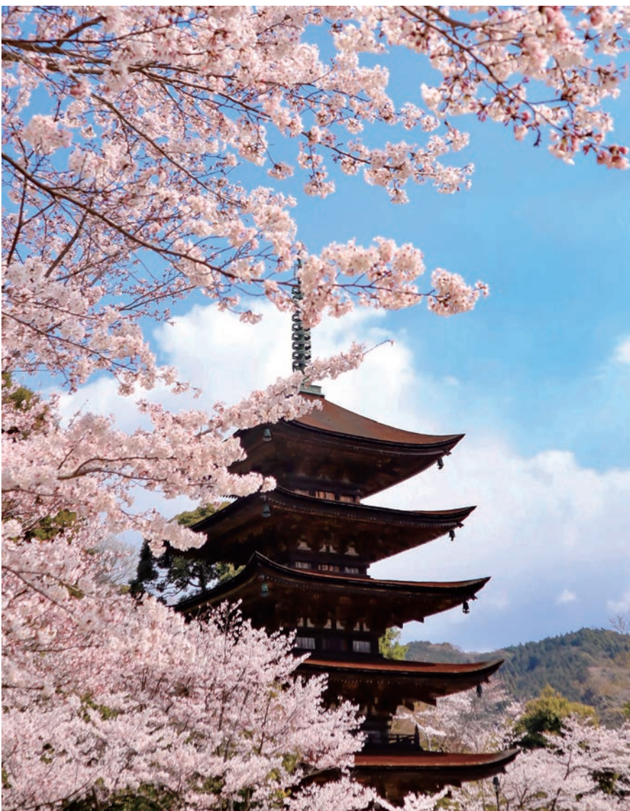
瑠璃光寺の五重塔と桜の美しい風景。

※すべての受賞作品は、サンデー山口ウェブサイト( http://www.sunday-yamaguchi.co.jp/shinnen/2020_shinnen_photo_winning.php )でもご覧いただけます。