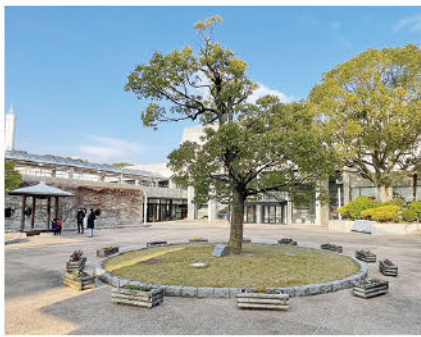
会場となる山口市民会館中庭

「つなぐ、キズナ」この史実を地域のプランナー、大内から現在、そしてド力向上にぎわいにつて未来へ」が、25日なげようと、「日本のク(日)午前11時から午後5時まで、山口市民会館(山口市中央2)で開かれる。」と宣言し、12月の山口市を舞台に趣旨に賛同する催しが繰り広げられる。「つなぐ、キズナ」を主催する山口商工会議所と山口観光コンベンション協会は「500年以上前の大内氏から今を生きている私たちに、山口の『キズナ』はきつとつながっているはず。たくさんある山口の良さを集め、市内全体がながるが読めるんだね。次々にうんちを見せられキズナは続く。四角いうんちが目が留まった。うんちは細長いものと思っていたから、不思議で、鼻君から本を奪い取り読んだ。うんちから水分を吸収する。うんちは直腸で作られ、直腸のひだはみぞが深く、ここにうんちが長く留まる(約一週間)と角ばった形になる。四角なら岩の上でも転がらない。縄張りを知らせるのに良い形なのだ。幼稚園児の持ち込んだうんち絵本は奥が深い。刺激され「ウオンパツトのうんちはなぜ、四角いのか?」(高野光太郎)を買った。今度は私が難易度の高いうんちクイズを幼稚園児に出してやろう。