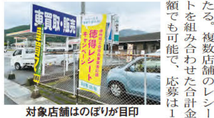
対象店舗はのぼりが目印

「徳得レシートキャンペーン」が、山口商工会が主催。11月30日(日)まで実施。対象店舗は30店舗。11月30日(日)まで実施。対象店舗は30店舗。11月30日(日)まで実施。対象店舗は30店舗。