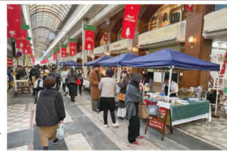
イベント開催時の中心商店街

ある舗装の改修工事が進行中。今後は、道場前商店街、西門前商店街、中町商店街を、市と商店街関係者との連携で進められていく。