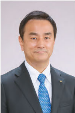
〔令和8年1月〕 県知事年頭あいさつ 山口県知事 村岡 嗣政